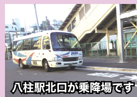
八柱駅北口が乗降場です

市民からのご要望を受け、総合医療センター行きシャトルバスの八柱駅北口乗り場に、ベンチを設置するよう市に働きかけておりました。平成30年度中に予算化することができ、無事に2月20日に設置され、ご利用が可能になりました。